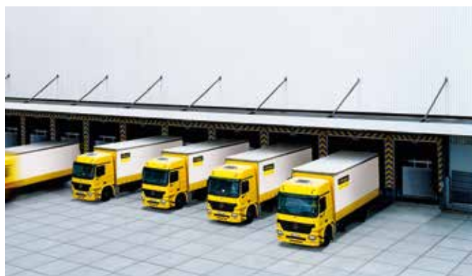
Vlastita logistika za pravovremene isporuke.