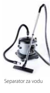
Separator za vodu