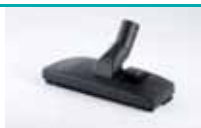
Četka za pod i tepihe