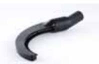
Četka za cijevi i grede