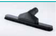
Četka za pod

Nikad čišćenje kuće nije bilo ovako jednostavno. Sa našim priborom za čišćenje možete očistiti sve površine, a rezultat je zapanjujući.