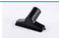
Četka za namještaj