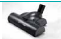
Četka za parkete sa filcom