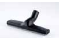
Četka za tekućinu