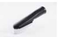
Četka za odjeću