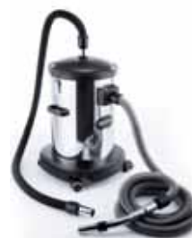
Separator za pepeo

Paleta dodatnog pribora razvijena je da bi se zadovoljila potreba čišćenja svih vrsta prostorija, u kojima se boravi ili radi. Postoje mnogobrojne četke za najrazličitije površine: Glatki podovi, parketi, tepisi, namještaj i tapisoni. Ali to nije sve: pronaći ćete pribor, sa kojim možete očistiti odjeću, grijača tijela, namještaj, kao i do sada nedostupne površine npr. fotelje, kutove, pepeo iz kamina ili razne tekućine. Uz Sistem Air sve je lakše.