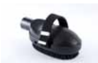
Četka za životinje