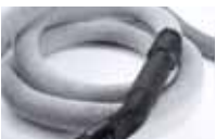
Presvlaka za crijevo