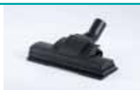
Felt brush for timber floors