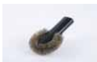
Četka za grijača tijela