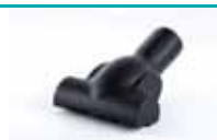
Turbo četka za namještaj