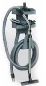
Standard accessory kit