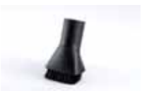
Četka za prašinu